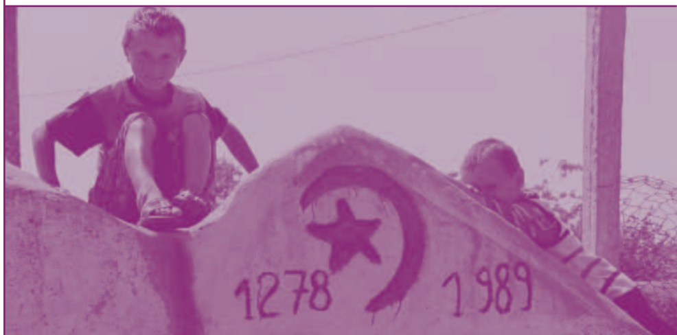
Copii de etnie turcă, satul Fântâna Adâncă