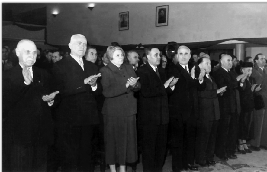
Foto 41. Lideri de partid și de stat în 1947. Printre ei, a treia din stânga, Ana Pauker.